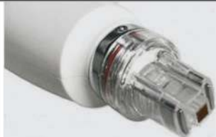
TESTINA AD ALTE PULSAZIONI

I NUTRIENTI SPECIFICI PENETRANO IN PROFONDITÀ IN MANIERA MIRATA